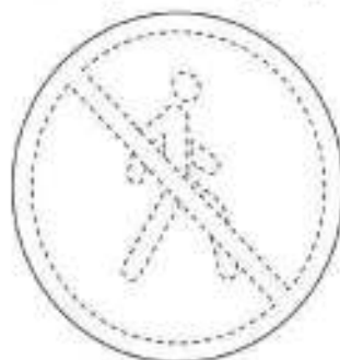
Движение пешеходов запрещено