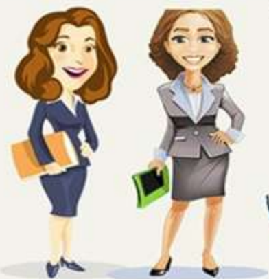
АДМИНИСТРАЦИЯ ДЕТСКОГО САДА